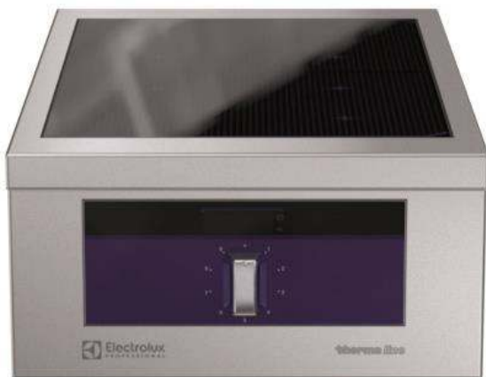
589502 Piastra di mantenimento elettrica top - 1 lato (MCRAAFOBO) operatore - L= 600 mm